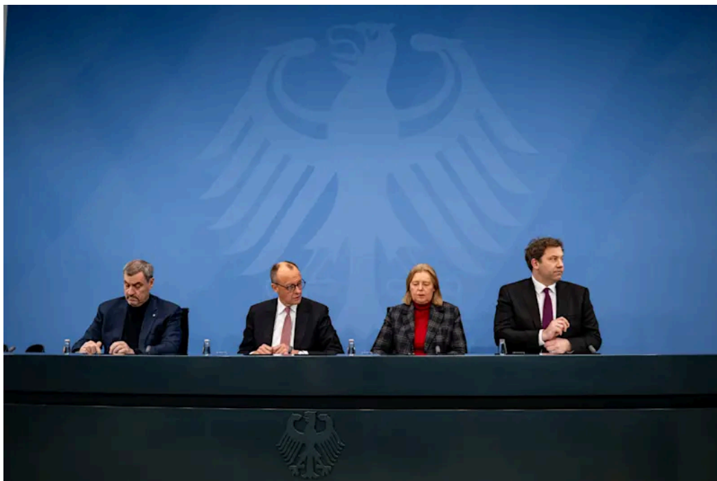
Koalitionsausschuss am 18.01.2026: Markus Söder, Friedrich Merz, Bärbel Bas, Lars Klingbeil

Die inhaltlichen Streitpunkte in den Kommissionen (Schuldenbremse und Wahlrecht):