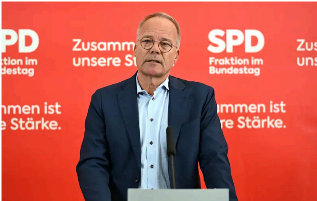
SPD-Fraktionschef Matthias Miersch, 03.03.2026

Gestern erhöhte die SPD den Druck: Fraktionschef Matthias Miersch forderte per Pressemitteilung: