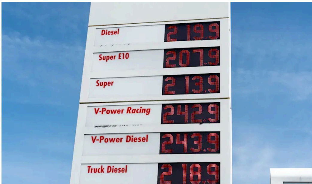
Tankstellenpreise, 10.03.2026