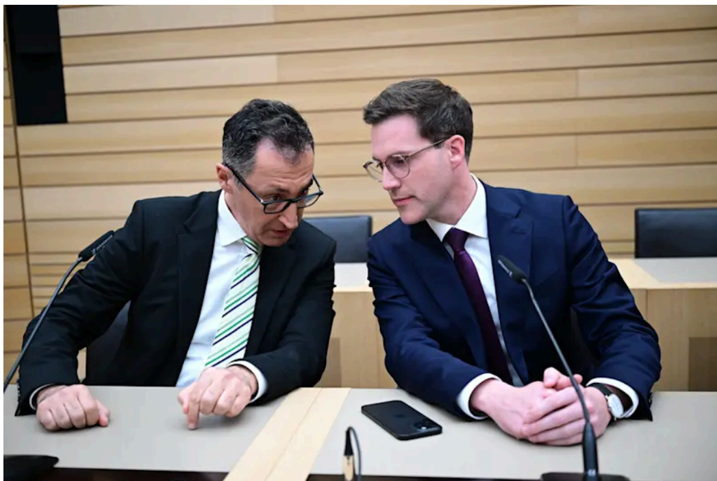
Cem Özdemir und Manuel Hagel, 08.03.2026

Nach Sitzen im künftigen Landtag von Baden-Württemberg herrscht ein Patt. Die CDU will den Preis für die Koalitionsverhandlungen weiter hochtreiben und machte den Vorschlag, das Ministerpräsidenten-Amt zu teilen. CDU-Spitzenmann Manuel Hagel wollte das nicht ausschließen, machte es sich aber nicht zu eigen.