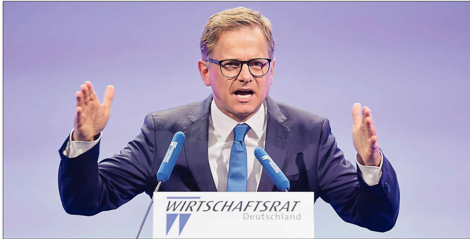
Energisch hat CDU-Generalsekretär Carsten Linnemann am Dienstag beim Wirtschaftstag des CDU-Wirtschaftsrats in Berlin für einen Staat geworben, der Bürokratie abbaut und seinen Bürgern und Unternehmern mehr vertraut. Die Gäste im Saal applaudierten stehend.